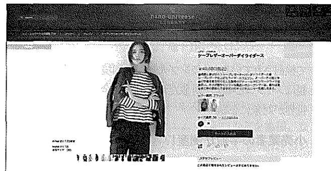
左：ナノ・ユニバースの自社ECサイト。こちらも3月にリニューアルする 右：ブランドおよびコーポレートロゴの新デザイン